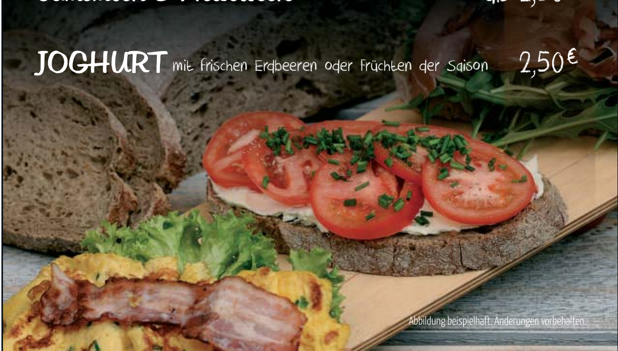
Abbildung beispielhaft. Änderungen vorbehalten.

JOGHURT mit frischen Erdbeeren oder Früchten der Saison 2,50€