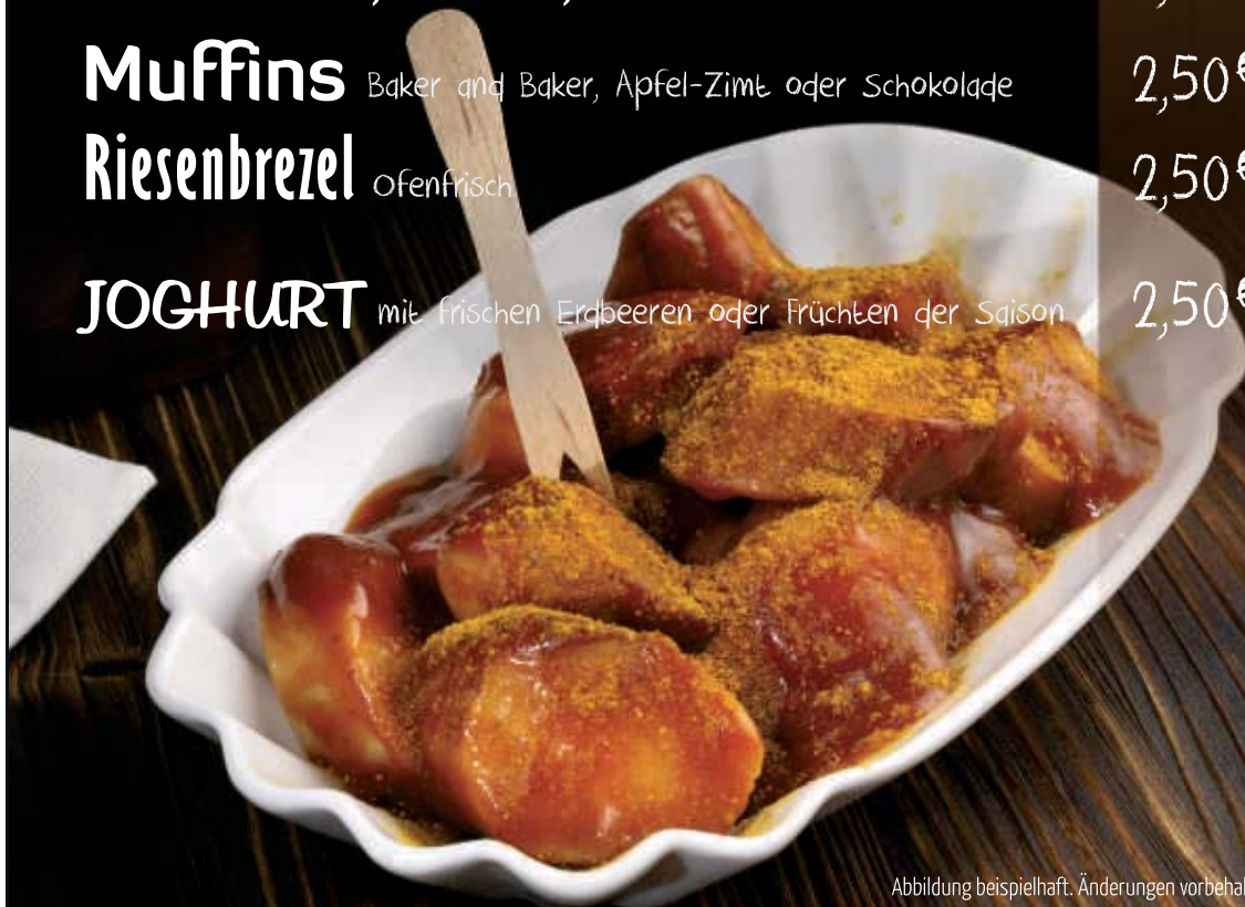
Abbildung beispielhaft. Änderungen vorbehalten.